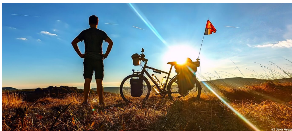
Sommet des Balkans – Bulgarie - 1500m