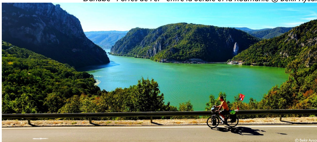
Danube - Portes de Fer - entre la Serbie et la Roumanie