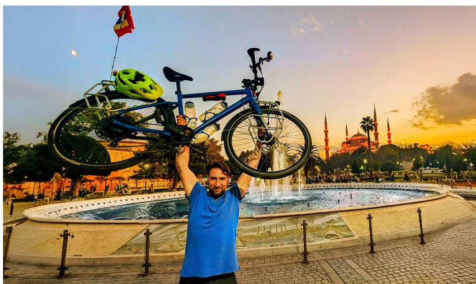
Istanbul – entre les mosquées Sainte Sophie et Sultan Ahmet