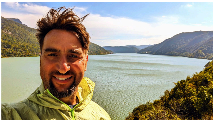
Portes de Fer – Serbie

Bekir Aysan est né à Istanbul et a grandi en Alsace .