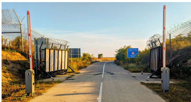
Frontières barbelées entre la Hongrie et la Serbie