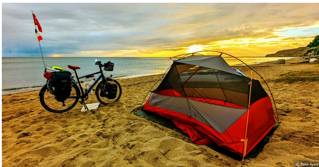
Dernier bivouac avant Istanbul – plage de Silivri