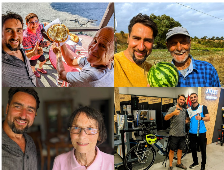
Rencontres et fraternités