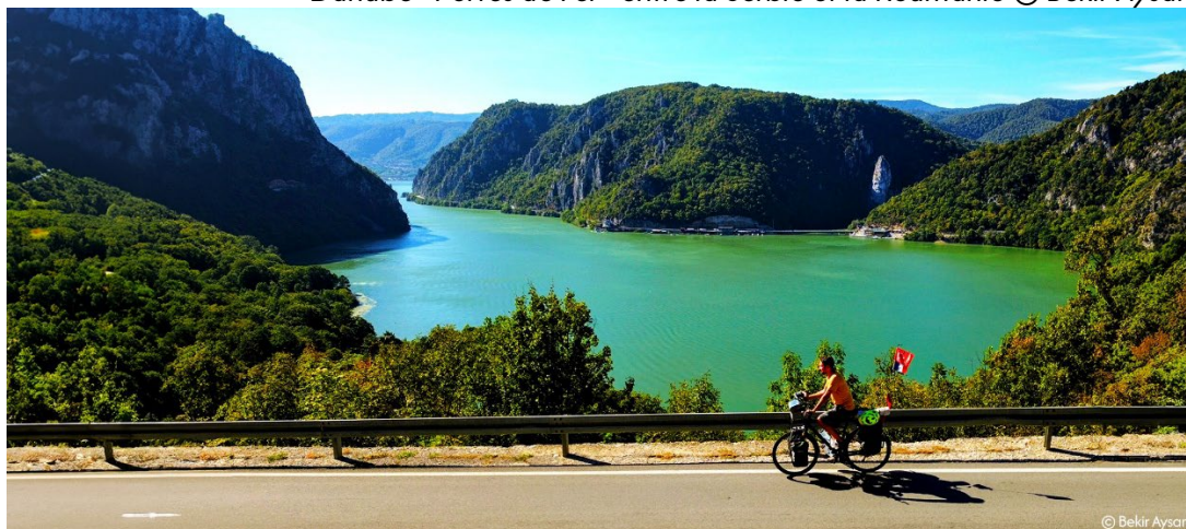
Danube - Portes de Fer - entre la Serbie et la Roumanie