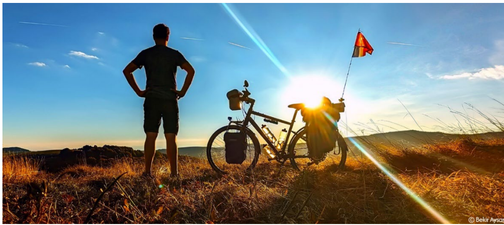
Sommet des Balkans – Bulgarie - 1500m